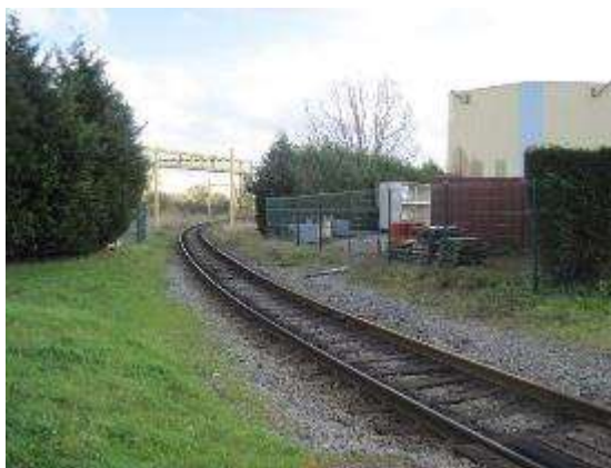
Autre vue de la voie ferrée accédant au site de production