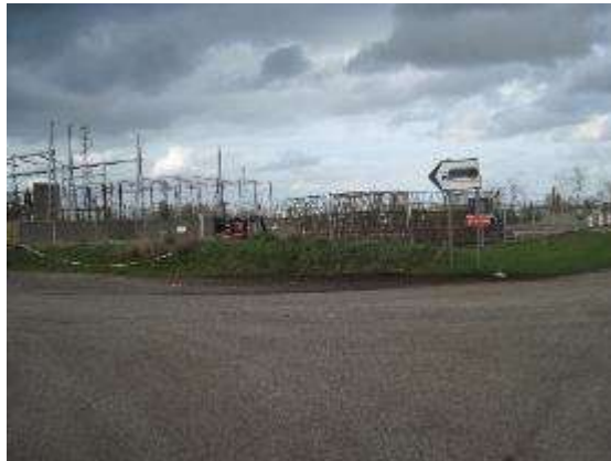
Vue de l'emplacement du futur poste électrique

La visite s'est terminée à 16 heures 00.