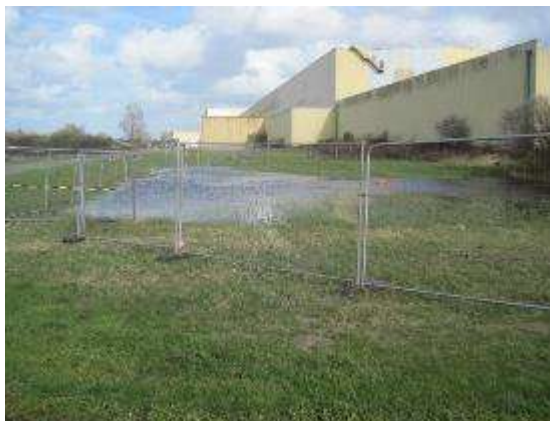
Autre vue générale du site et de la petite zone humide qui le jouxte qui ne sera pas impactée