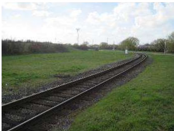
Vue de la voie ferrée qui sera doublée