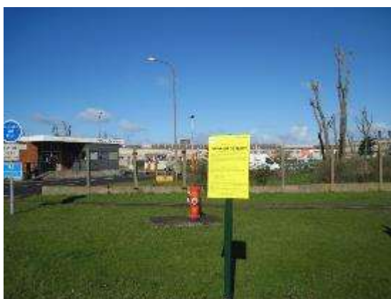
Entrée Sud du site de Dunkerque à Grande-Synthe