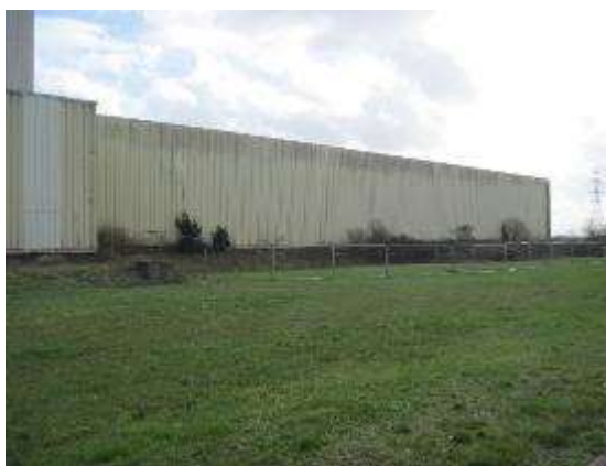
Vue des halls 8 à 11 futur site de production