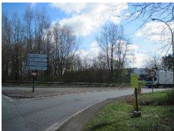
Rond-point de l'A16 et du RD 131 à Grande-Synthe