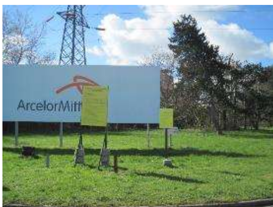
Entrée du site de Mardyck à Grande-Synthe