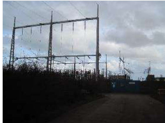
Vues du poste électrique et du réseau électrique existants