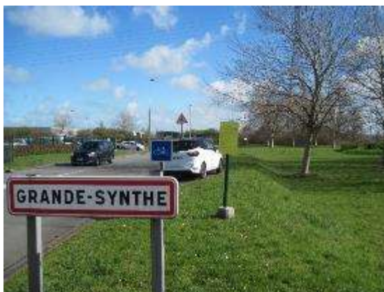
Entrée ZI de Grande-Synthe à Grande-Synthe