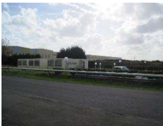
Vues générales des bâtiments où seront implantées les futures unités de production