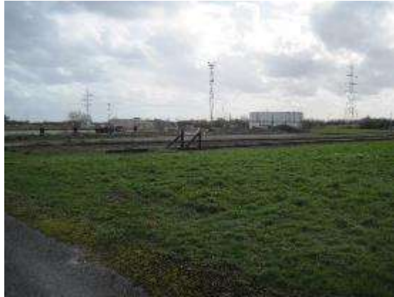
Vue de la zone où sera construit le local des vernis

Projet d'exploitation d'une filière de production d'aciers électriques à Grande-Synthe et Dunkerque