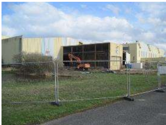
Vue de l'arrière du site dont une partie est en cours de démolition et où sera construite la tour