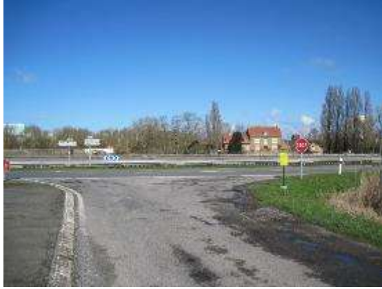
Intersection du RD2 et du RD131b à Spycker