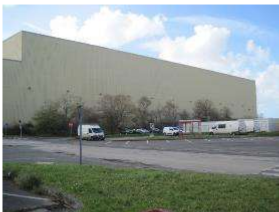
Vue de la halle 9 où arrivent les coils