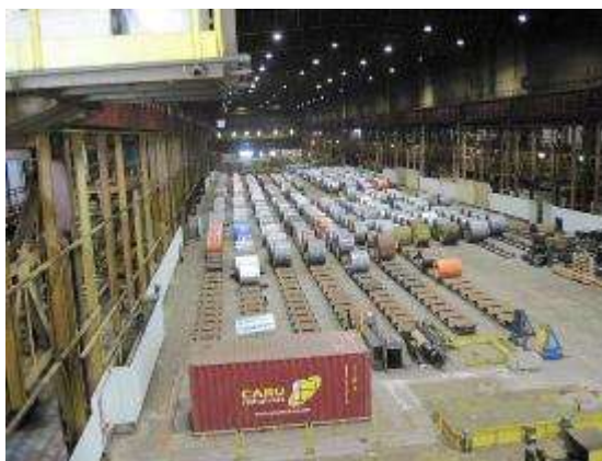
Vues intérieures des halls 8 à 11 où seront produits les aciers électriques